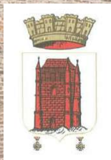
Blason de la commune