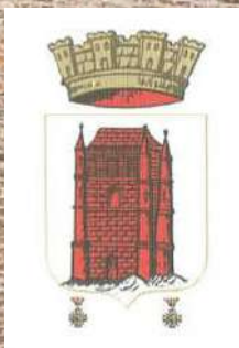
Blason de la commune

La commune de Bouchain fait partie de la Communauté d'agglomération de la Porte du Hainaut.